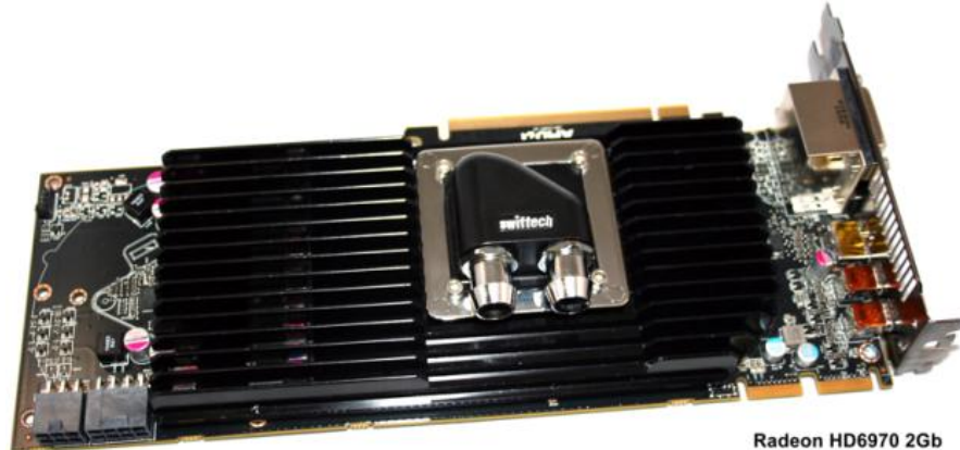
Radeon HD6970 2Gb

For AMD® Radeon™ HD 6970 (Reference design boards) to use with Swiftech MCW60, 80, 82 Waterblock's (not included)